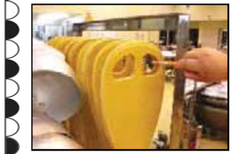
↑ふき取り検査の様子

その他に、器具・設備等がきちんと洗浄できているかを確認するため、ふき取り検査を随時実施しています。この検査により、汚染のリスクが高いところは、より注意して洗浄することができます。 このように、安全でおいしい給食を提供するために、職員一人ひとりが高い意識を持って調理や洗浄作業等に当たっています。