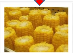
蒸して出来上がり