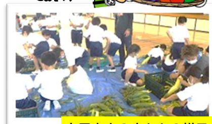
上里東小の皮むきの様子