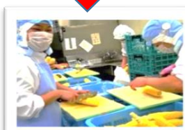
給食センターでカット